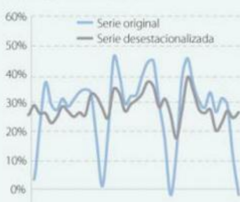
Expectativas de producción para el próximo trimestre