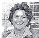
BEATRIZ URIBE BOTERO MINISTRA DE VIVIENDA

"Hay que ver realmente que tanto empleo formal se está generando porque no se ven mayores cambios. Llama la atención el especial aumento de trabajadores por cuenta propia".