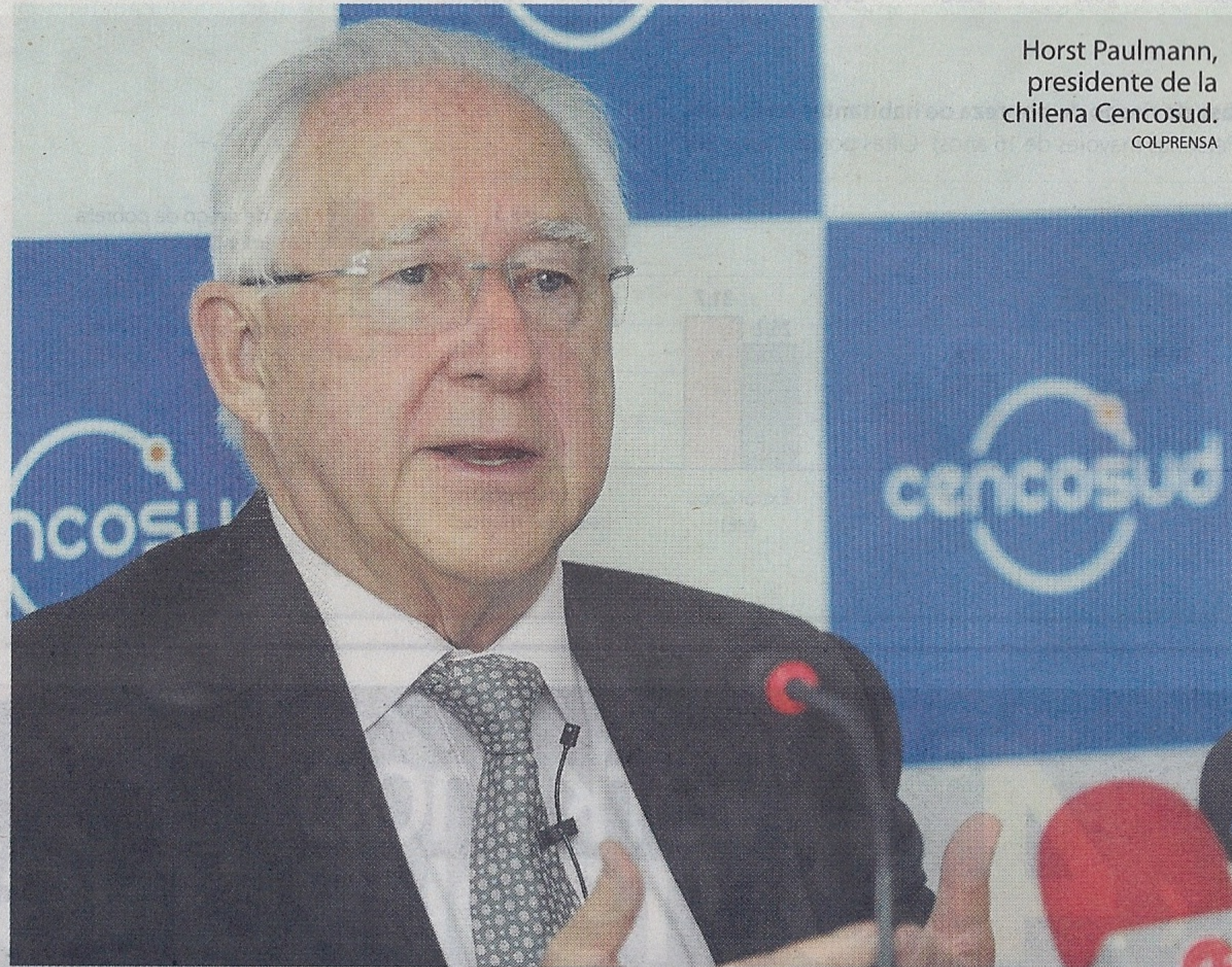
Horst Paulmann, presidente de la chilena Cencosud.