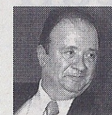
LUIS CARLOS VILLEGAS PRESIDENTE SALIENTE DE LA ANDI

Es economista de la Universidad de Los Andes y tiene estudios de maestría en desarrollo económico. Fue viceministro de Hacienda cuando el titular de esa cartera era Juan Carlos Echeverry . De allí saltó a la dirección del Departamento para la Prosperidad Social (DPS) . Tiene 18 años de experiencia en banca de inversión y fue fundador de Inverlink , la primera de su tipo en el país. Se desempeñó como profesor, gerente financiero de Propilco , Aceitales , Concentrados y Siderúrgica del Caribe , miembro de las juntas directivas de ISA , Isagen , Colombia Telecomunicaciones , Bancoldex y Fiduciaria Previsora .