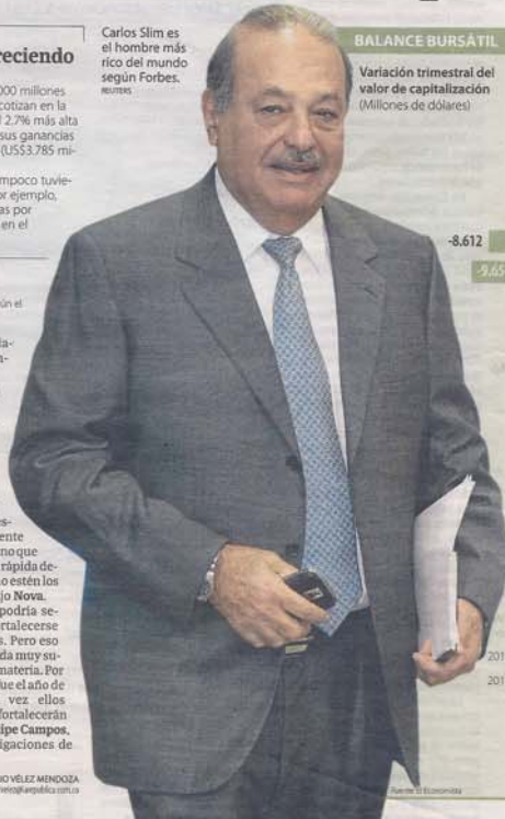
Carlos Slim es el hombre más rico del mundo según Forbes.

ROGELIO VÉLEZ MENDOZA rovel@arepublica.com.co