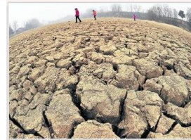
Los aspectos ambientales de la sustentabilidad merecen un seguimiento en el que indique qué medida nos acercamos a niveles peligrosos.

Recomendar | Sé el primero de tus amigos en recomendar esto.