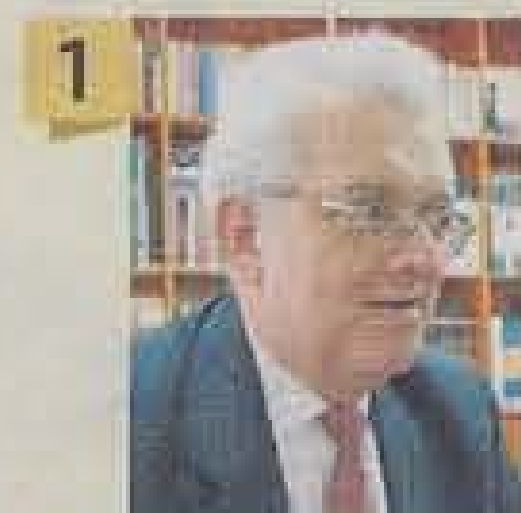
JOSÉ ANTONIO OCAMPO

Economista y sociólogo de la Universidad de Notre Dame. Tiene un Ph.D. en Economía de la Universidad de Yale. Fue ministro de Hacienda y de Agricultura, director del DNP. Fue secretario ejecutivo de la Cepal y ocupó varios cargos en las Naciones Unidas.